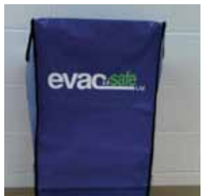
5. Plaats de stoel terug in de opberglocatie en doe de beschermhoes er weer op.