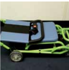
4. Klap de armleuningen terug. Sluit de stoel en maak de veiligheids gordel vast.