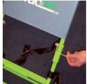
3. Bevestig veiligheids gordel rondom de stoel en breng de stoel naar de opberglocatie.