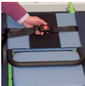
5. Plaats de stoel terug in de opberglocatie en doe de beschermhoes er weer op.