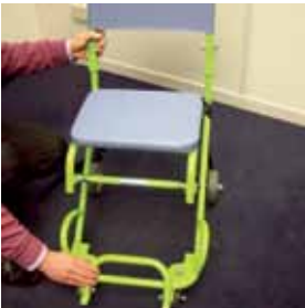
1. Houd het achterframe en de achterkant van het stoelframe vast.