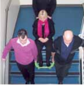
9. Eenmaal aanbeland op de overloop dient u de stoel te laten zakken in een statische stand en zich voor te bereiden op de volgende trap.