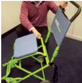
2. Maak los van de beugel en laat naar de grond zakken.