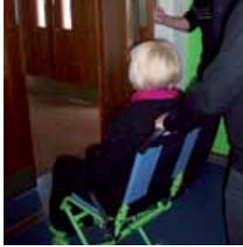
10. Eenmaal aangekomen op de begane grond evacueert u naar de uitgang.